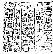
正一天師清微弟子洪百堅製作

玄真曰三符印乃東極青宮九龍符命出青玄法太一慈尊所主玉清拔幽魂真符玉清破地獄真符出神霄錄上古聖師集而為印持假太上之力拔度幽爽耳用于寶錄之上今有邊郭者非也