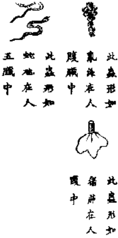
此蟲形如 象海在人 腹中 此蟲形如 備在人 腹中 此蟲形如 蛇在人 五臟中