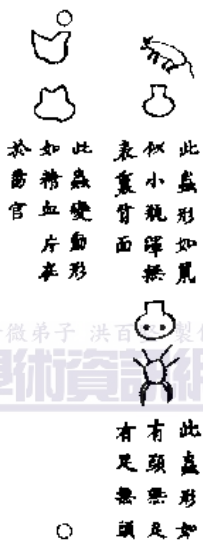
此蟲形如鼠 似小瓶蟬無 表裏背而 此蟲變動物 如精血片在 於腸胃 此蟲形如 有頭無足 有足無頭

已上諸蟲入肝經而歸腎得血而變更也令人多怒氣逆筋骨拳拳四肢解散唇黑面青增寒壯熱腰背疼痛起坐無力頭如斧斫眼睛時痛腎膜多淚背膊刺痛力乏虛羸手足乾枯卧着床枕不能起止有似風中肢體頑麻腹內多痛眼見黑花忽然倒地不省人事夢寐不祥覺來遍體虛汗或有面色紅潤如平時者或有通靈而言未來事者其蟲遇癸未日食起醉歸肝俞穴中四穴輪轉周而復