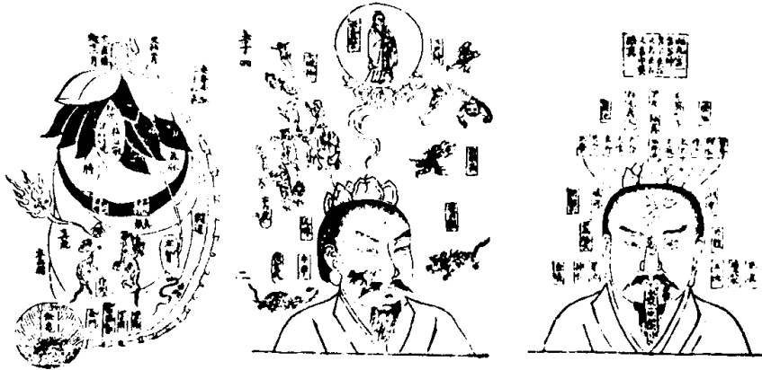
煙蘿子朝真圖 煙蘿子朝真圖 煙蘿子朝真圖

養生息命詩 捉得金精養命基 日華東畔月華西 壺中自有長生藥 返老還童天地齊 勸君勤學守三一 中有長生不死術 能存玄真萬事畢 一身精神不妄失