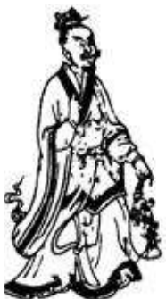
淺紅衣淺黃裙青緣

乾第一鬼神 名興文 能興人辟兵 所出入處 人常尊敬之 能報怨讎事 往來為人除害 能卻陰邪之事 其神圓冠 有三道佛 以麥索著古衣草帶 右手持刀 左手垂下